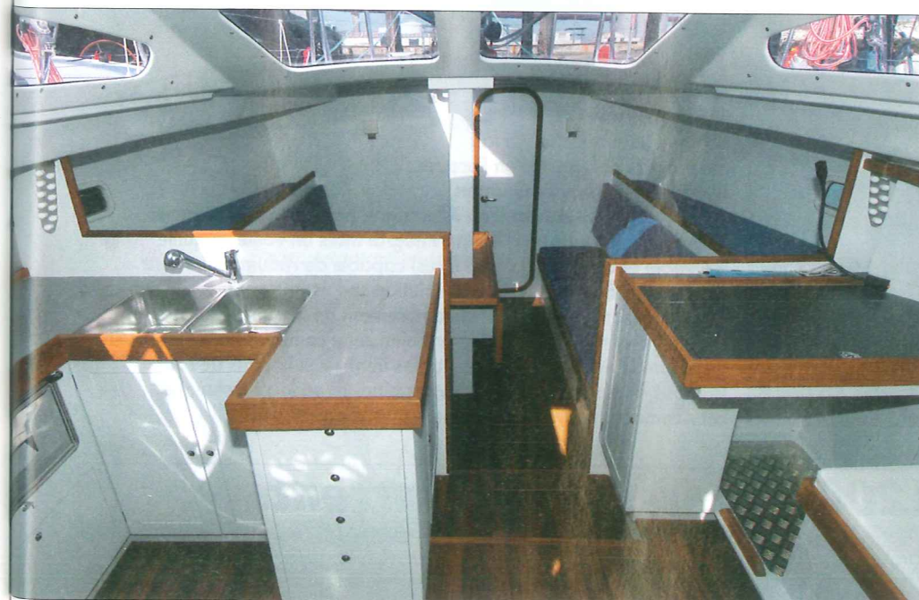
La cuisine et la table à cartes sont légèrement plus hautes que le carré, ce qui permet de bénéficier de toute la visibilité offerte par les grands hublots du rouf. Remarquez les couchettes de mer derrière les banquettes.