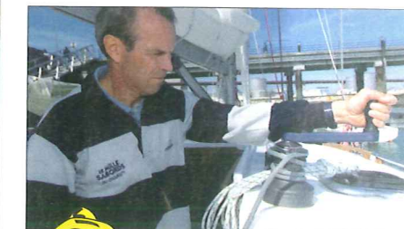
Les winches de drisse sur l'arrière du rouf sont trop hauts pour bien travailler.