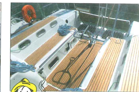
De nombreux équipements intégrés dans les hiloires du cockpit.